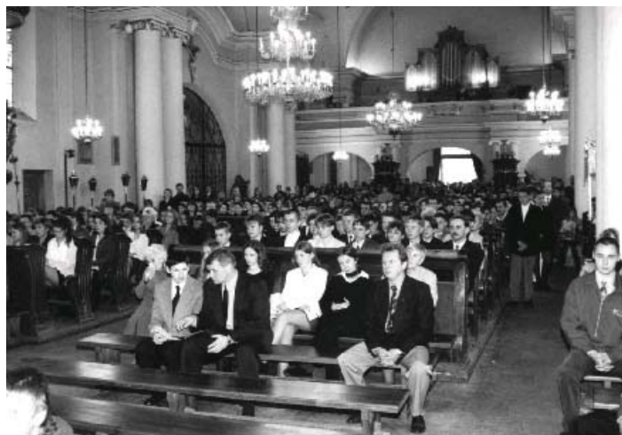
W kościele zgromadziła się młodzież ze świadkami i najbliższą rodziną