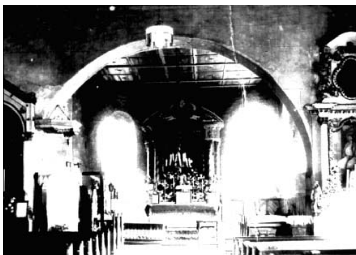
„Kaplica akademicka” jako prezbiterium starego kościoła początek lat dwudziestych XX w.