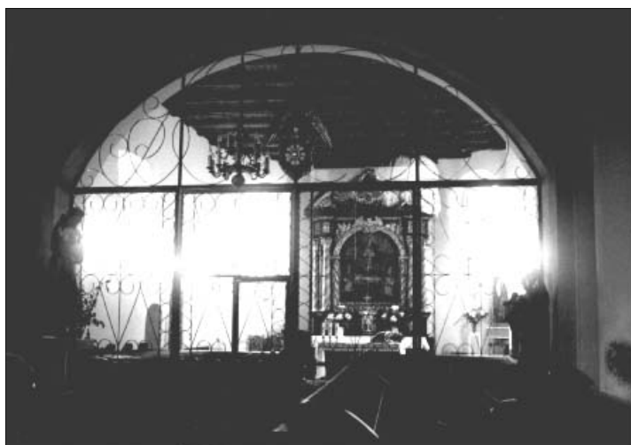
„Kaplica akademicka” obecnie

zagrzybionych i zawilgoconych tynków, ich dezynsekcji, osuszenia i izolacji oraz nałożenia nowej wapiennej warstwy tynku i wymalowania, wymiany drewnianych ram okiennych na metalowe i przełożenia elementów figuralnych oraz uzupełnienia pozostałych części szkłem witrażowym. Wymieniono również posadzkę kaplicy. Dotychczasowe dwubarwne kwadratowe płyty ceramiczne