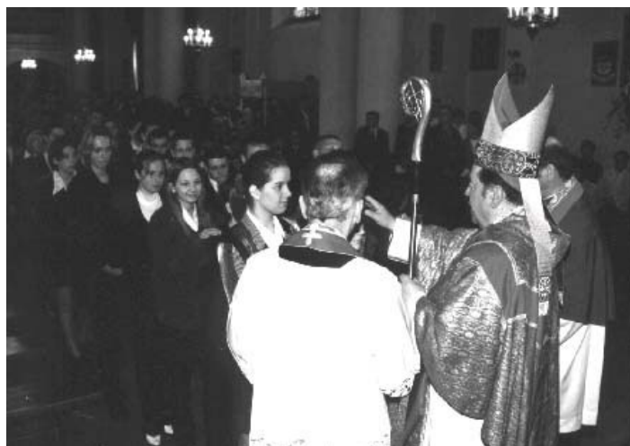
Ksiądz Biskup udziela sakramentu Bierzmowania młodzieży naszej parafii.