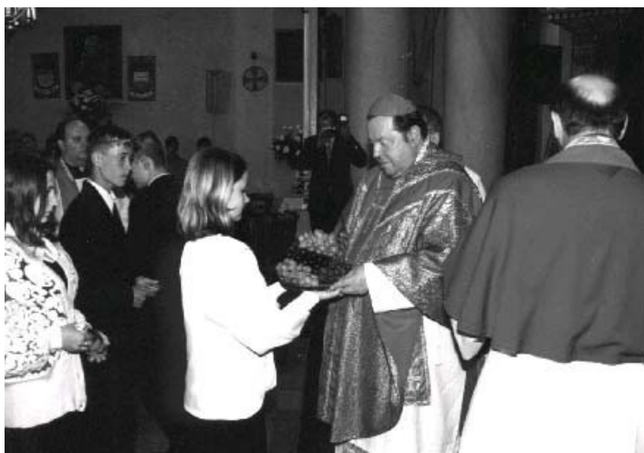
Składanie darów ofiarnych.